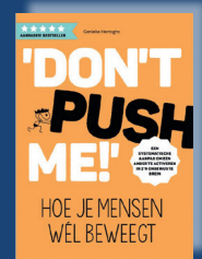
Don't push me Genieke Hertoghs