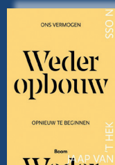
Wederopbouw Leike van Oss

Na elk college ontvang je het boek van de spreker. Negen inspirerende titels voor verdieping en zelfstudie.